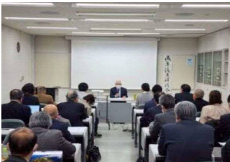
☆成年後見業務研修講義の様子