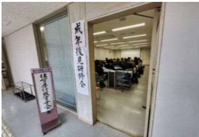
☆開催会場 アバンセ研修室

これから急速に進む高齢化社会に伴い、担い手不足が深刻となる中、裁判所や公証人連合会からの協力要請があるなど、今後、行政書士も職業後見人として社会からの期待は増していくものと思われまます。