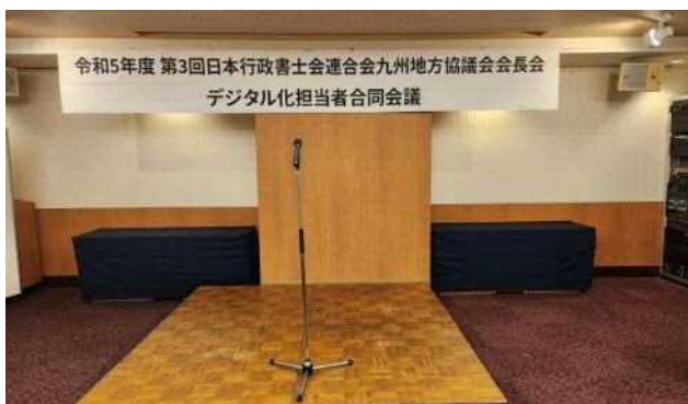
☆会場 ホテル・レクストン鹿児島